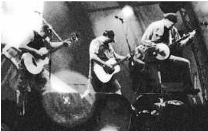
Die Hayseed Dixies heizen ein.

Jedes Jahr am ersten Wochenende im Juli verwandelt sich ein kleines Städtchen in Thüringen zum Epi-Zentrum der Weltmusik. Was gerade im Osten Deutschlands nicht vermutet wird – Weltoffenheit, Multikulti und friedliches Beisammensein –, wird dort wie selbstverständlich seit Jahren gelebt. Ganz im Gegenteil, vieles was dort geht, wäre in manchen Westkommunen nur schwer denkbar. Die Rede ist von Rudolstadt und das Festival heißt TFF (Tanz und Folk Festival). So jedenfalls die ursprüngliche Bezeichnung.